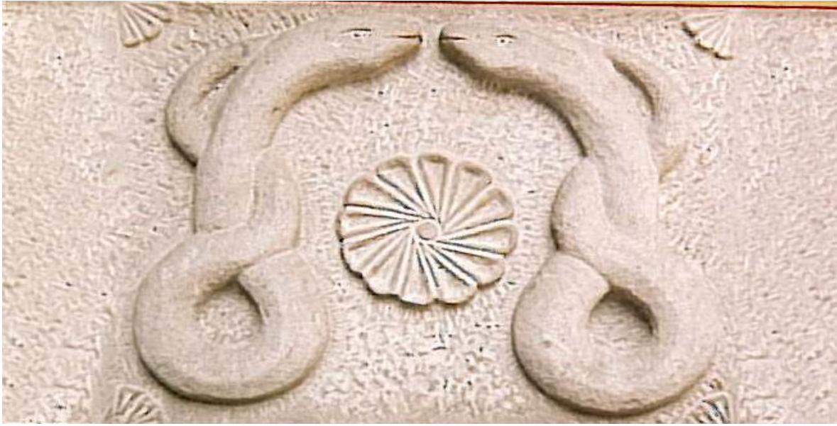
Figür 5. Şifahiye'nin sembolü; iki yılan ve Selçuklu madalyonu (restore edilmiş form)

Şifahiye, merkezi bir avlu etrafında, hastaların sabah ve akşam saatlerinde dinlenmeleri için dört eyvan ve öğrencilerin yaz ve kış dönemlerindeki eğitimlerinde kullanılan kubbeli odalardan oluşmuştur (fig 6). Tedavide kullanılan bir Türk hamamı ve küçük bir mescit de bulunmaktadır. Bu bina kompleksinde, ana hastane binasından tamamen ayrılmış bir zihin hastalıkları hastanesi (bimarhane) bulunmakta olup 18 odadan oluşmaktadır. Her odada ses iletiminde kullanılmak üzere basit bir hoparlör görevi yapan iki adet oluk yer almaktadır. Bu bulgu yine Selçuklular döneminde Şam'da kurulmuş olan Nureddin Darüşşifası'nda (1154) zihinsel hastalıkların müzik ve ses ile tedavi edildiği hatırlandığında sürpriz değildir (5).