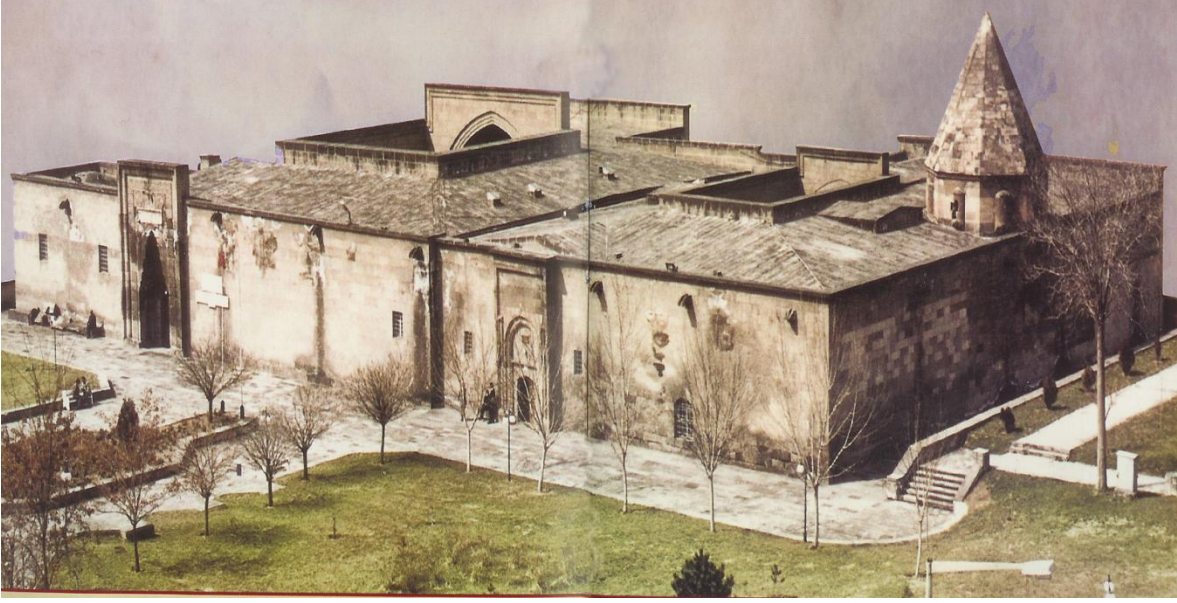
Figür 1. Gevher Nesibe Şifahiyesi

Gevher Nesibe Şifahiyesi 1204-1206 yılları arasında inşa edilmiştir (fig 1) ve 1890'a kadar eğitim hastanesi olarak faaliyet göstermiştir. İnşa tarihine dair bilgi ana giriş kapısı üzerindeki taş kitabeden okunmaktadır (fig 2). Kitabede, 'Bu maristan (hastane), Kılıçarslan oğlu Büyük Sultan Gıyaseddin Kayhüsrev'in –Allah ondan razı olsun-zamanında Kılıçarslan kızı İsmetüddin Gevher Nesibe'nin vasiyeti üzerine Allah rızası için 602 senesinde (miladi 1206'ya denk gelmektedir) inşa edildi.' yazılıdır.