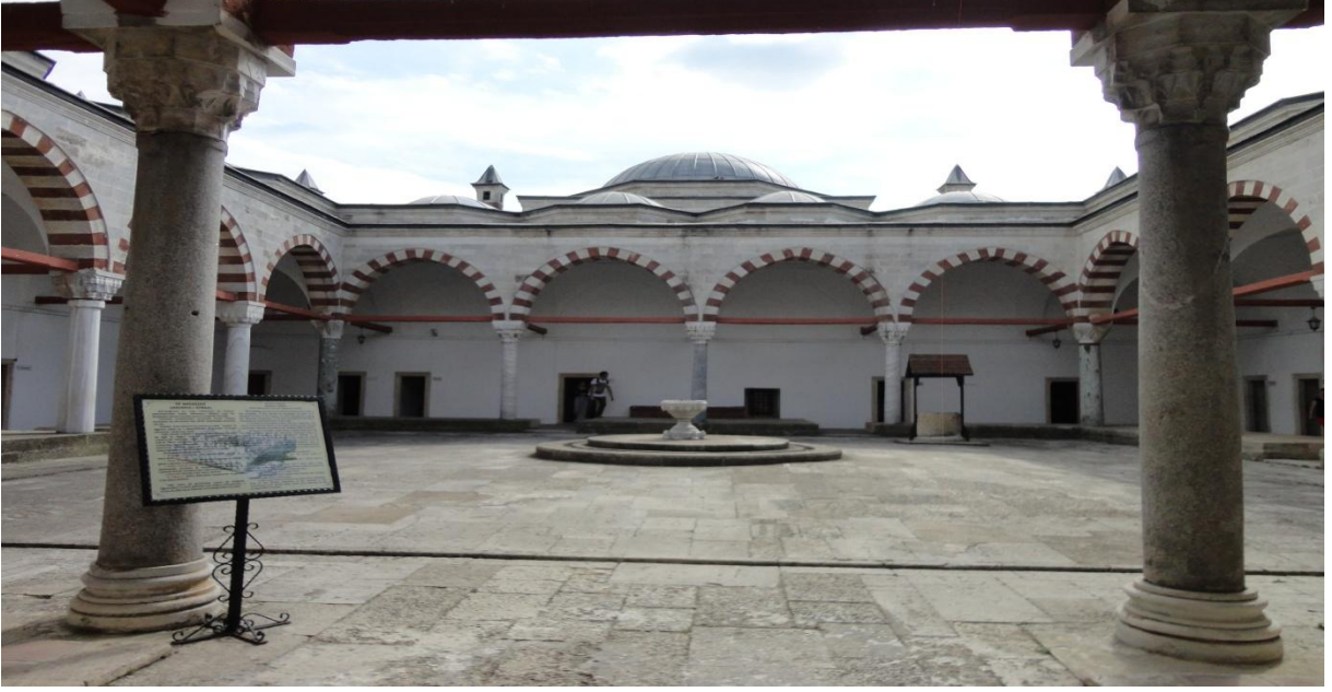
Tıp Medresesi Avlusu