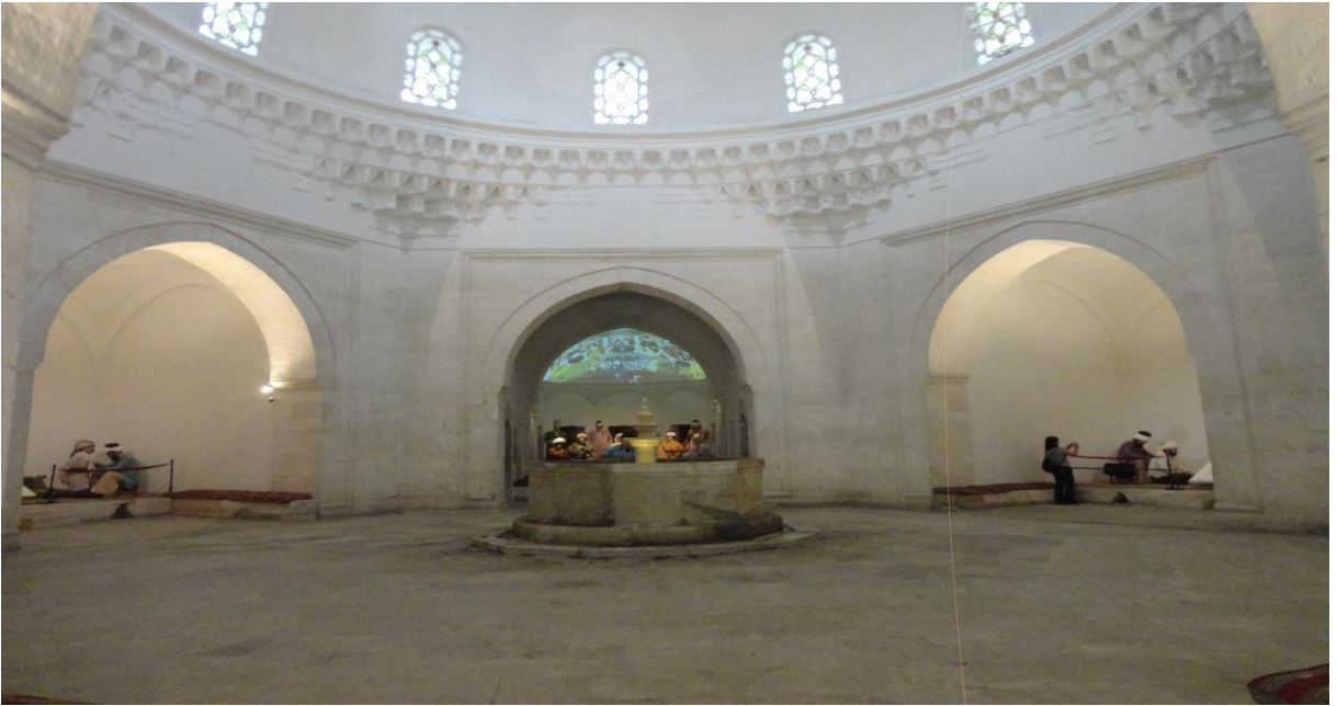
Şifahane de Bulunan Su Şadırvanı

Üçüncü bölüm geçmişte hastaların yatırıldığı birimdir. Burada 4 yazlık, 6 kışık oda ve bir musiki sahnesi vardır. Ortadaki havuzun şadırvanından su akmaktadır. Burası geçmişte ruh hastalarının musiki, su sesi ve güzel kokularla tedavi edildiği akustiği ile ünlü mekândır.