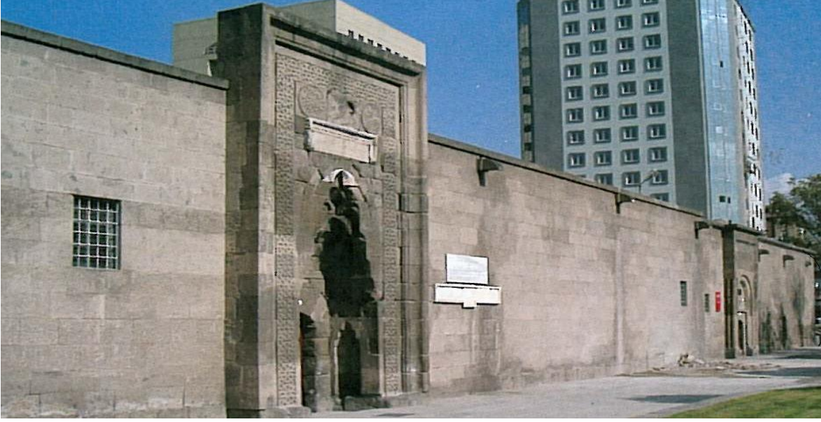
Figür 4. İki giriş kapısının günümüzdeki görünümü

Şifahiye'nin en önemli mimari özellikleri iki ana giriş kapısı üzerinde yer almaktadır (fig 4). Motiflerden biri, birbirine bakmakta olan iki yılan figürü olup, merkezde de bir Selçuklu çark-ı feleği bulunmaktadır (fig 5). Orta Asya'dan beri yılan, Türklerde 'hayat ağacının koruyucusu' kabul edilir ve mutluluk sembolü ile büyük benzerlik gösterir (2).